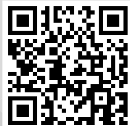
Aplikasi Ventour Mobile